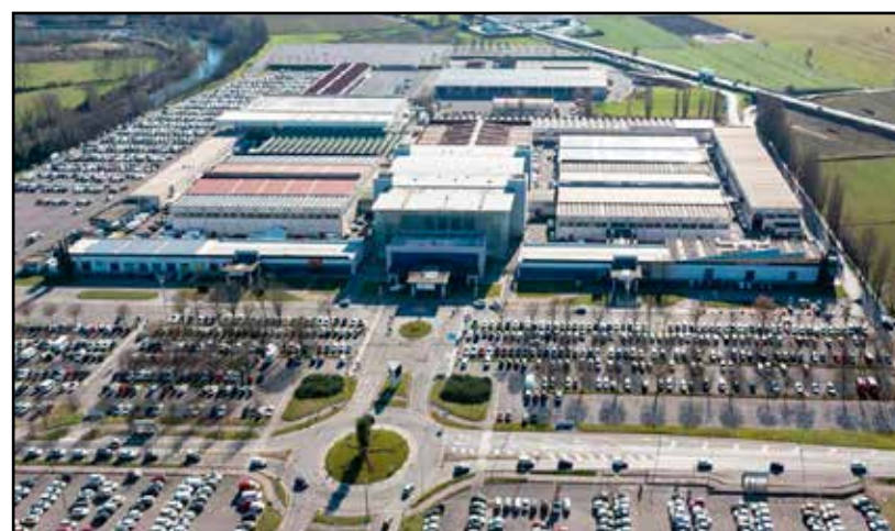
Il Centro Fiera di Montichiari.

Praticamente dal primo dell'anno la Fiera di Montichiari viene gestita da una unica società; una fusione fra le due s.p.a. come previsto dalla legge nazionale. Le quote societarie non sono cambiate con il COMUNE DI MONTICHIARI che detiene la maggioranza con il 76%, con la Provincia di Brescia che conferma il suo 20% così come la BCC del Garda con il suo 4%.