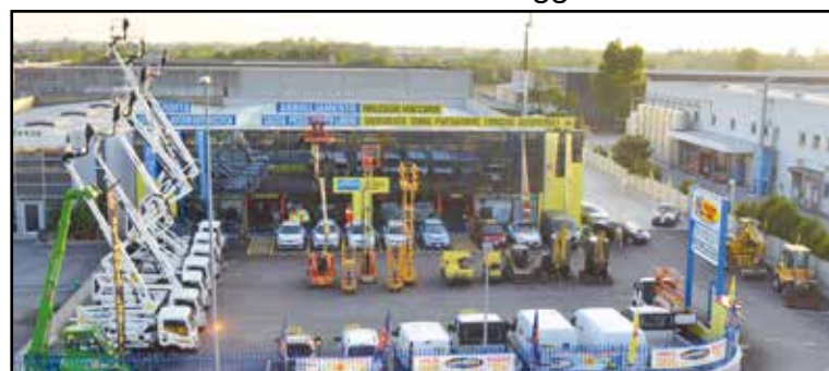
La nuova sede della Noleggio Lorini in zona industriale, via E. Montale 15.

SEDE: MONTICHIARI (BS) - Via E. Montale, 15 FILIALI: CALCINATO - CASTEGNATO tel. 030.9650556 - www.noleggiolorini.com